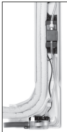
- Configurazione contatti -

Si prega di riferirsi al manuale di istruzioni del sistema di condizionamento per le connessioni del corretto spengimento oppure al manuale del sistema di allarme per le relative connessioni.