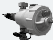
Defangatore magnetico mm 160 x 140 x H 140